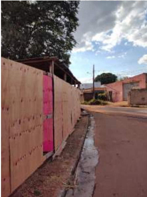
Foto 35 - Execução de telhado do barracão de obra