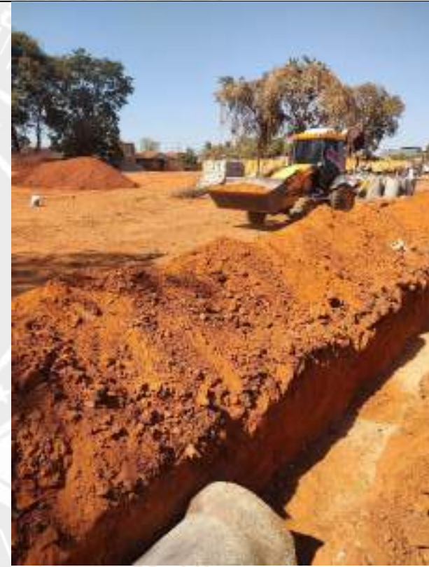
Foto 130 – Assentamento de manilhas de 600mm