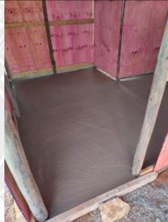
Foto 44 - Acerto e concretagem de piso dos barracões de obra