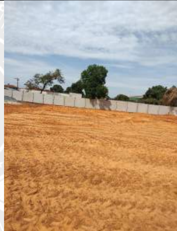
Foto 258 – Execução de aterro compactado