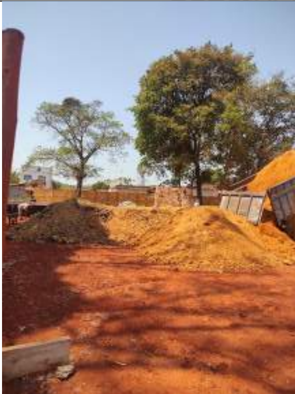
Foto 185 – Execução de aterro compactado da construção