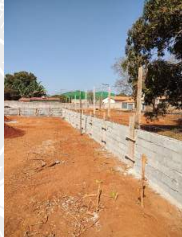
Foto 86 – Execução de muro de arrimo e concretagem de pilares