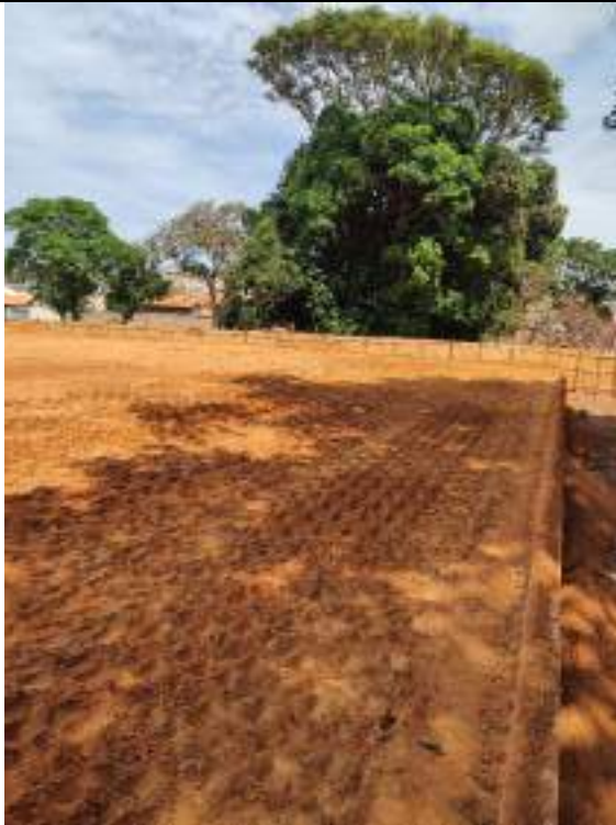
Foto 261 – Execução de aterro compactado