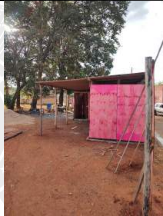
Foto 34 – Execução de telhado do barracão de obra