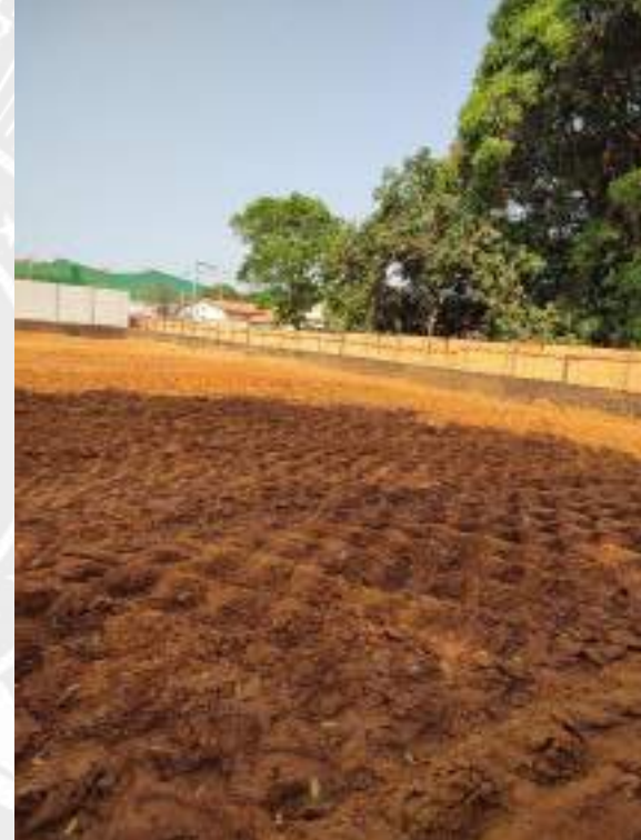
Foto 216 – Execução de compactação mecanizada do aterro da obra