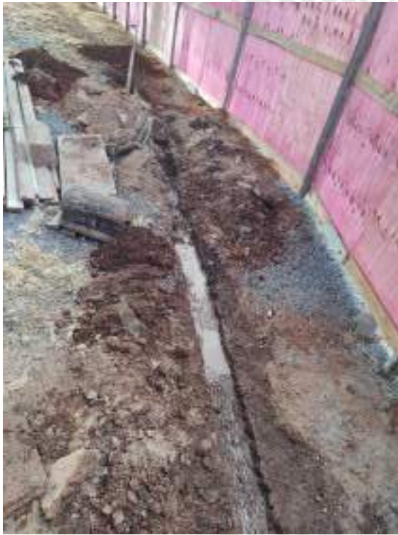
Foto 49 – Execução de redes hidrossanitárias do banheiro do barracão de obra