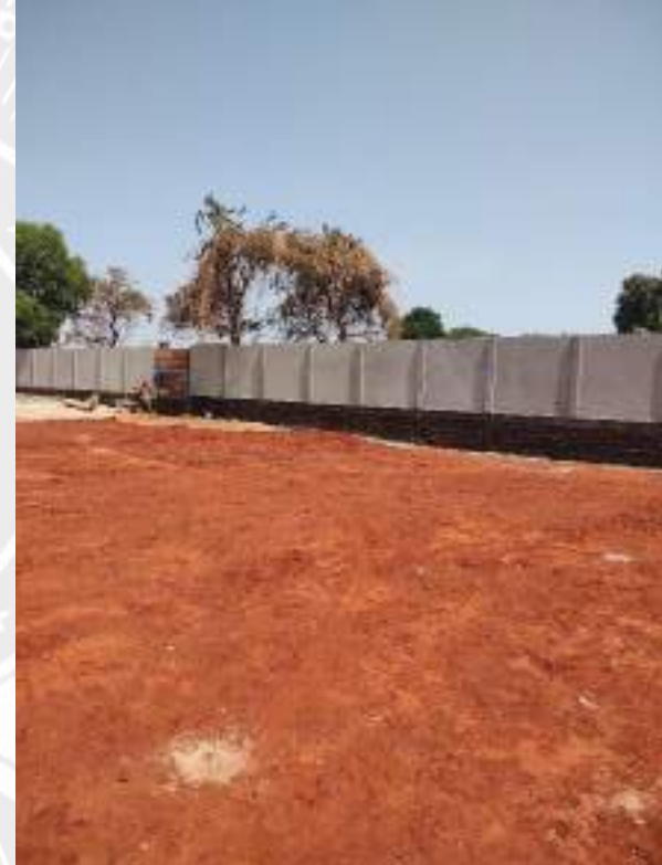
Foto 188 – Chapisco e reboco do muro de divisa