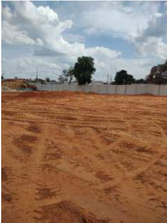
Foto 253 – Execução de aterro compactado