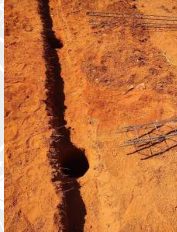
Foto 72 – Execução de fundação muro de arrimo