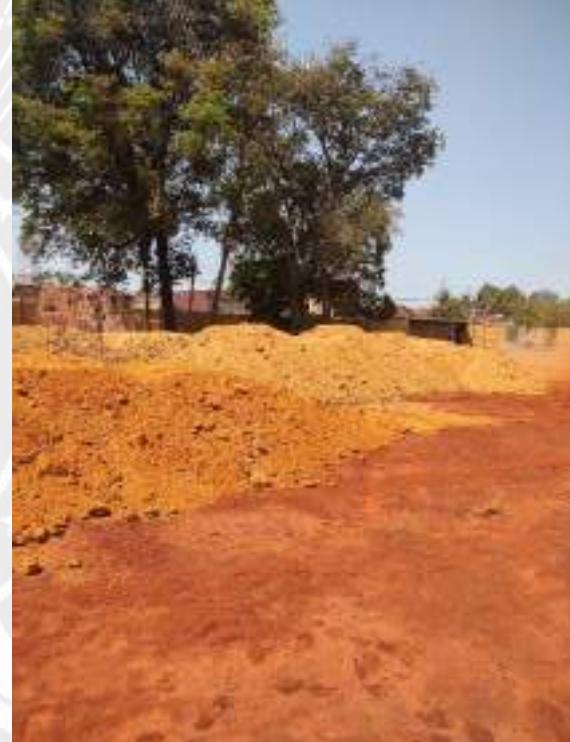
Foto 190 – Execução de aterro compactado da construção