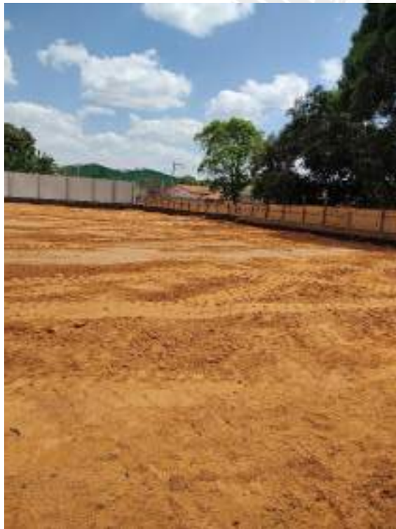
Foto 197 – Acerto e nivelamento de aterro compactado da construção