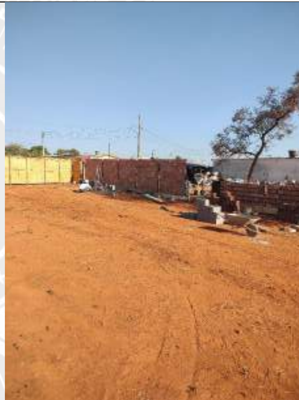
Foto 106 – Execução de muro de divisa