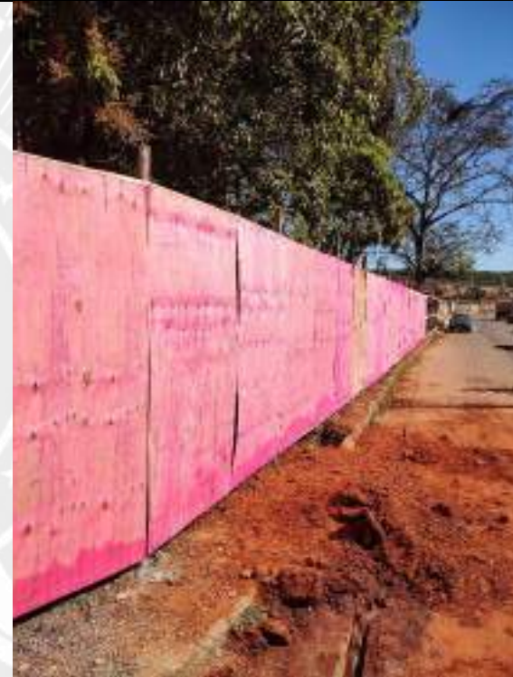
Foto 28 - Execução de tapume para fechamento de obra