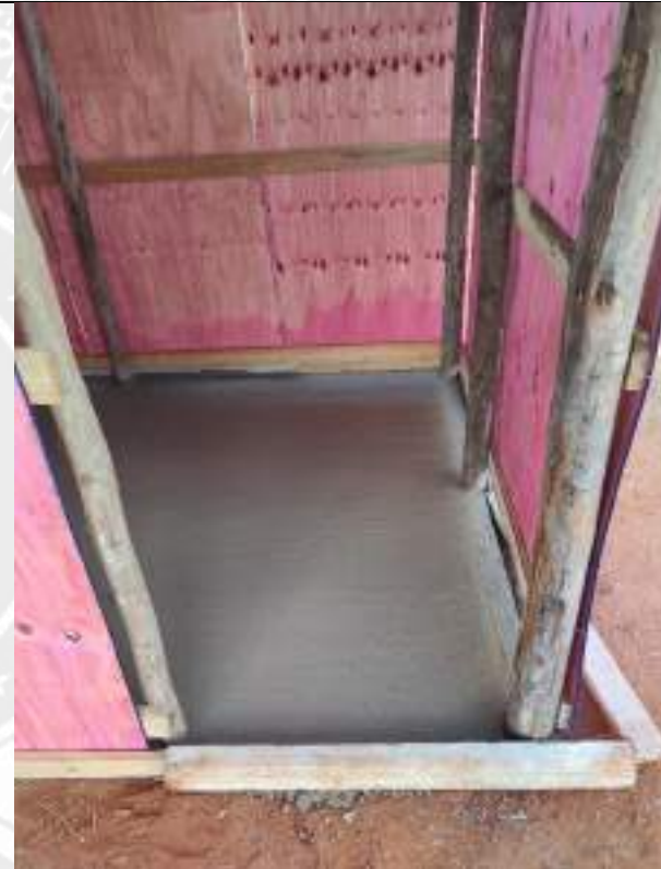
Foto 42 - Acerto e concretagem de piso dos barracões de obra