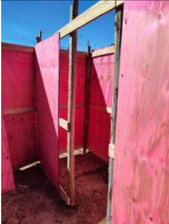
Foto 15 - Execução de sanitário do barracão de obra