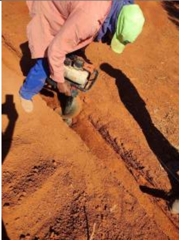
Foto 67 – Execução de fundação muro de arrimo