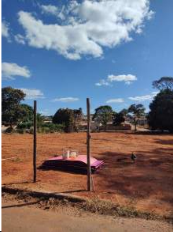
Foto 3 - Execução de tapume para fechamento de obra