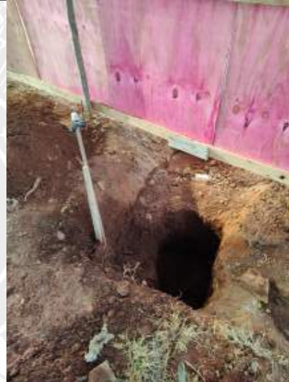
Foto 50 – Execução de redes hidrossanitárias do banheiro do barracão de obra