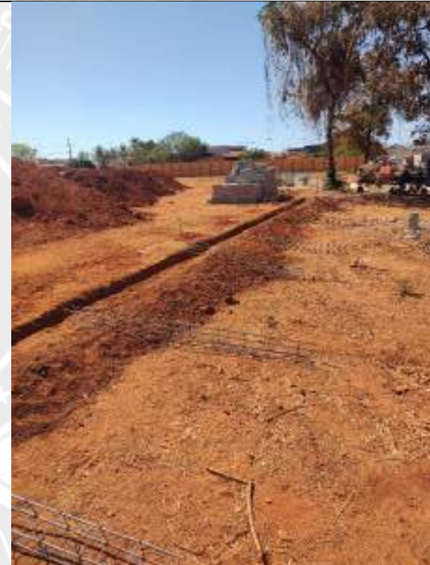
Foto 76 – Execução de fundação muro de arrimo