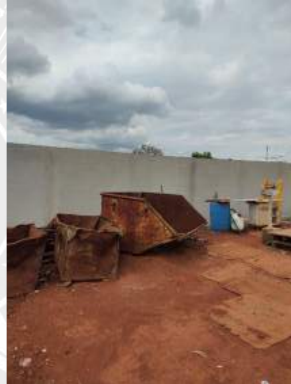
Foto 268 – Reboco dos muros de divisa