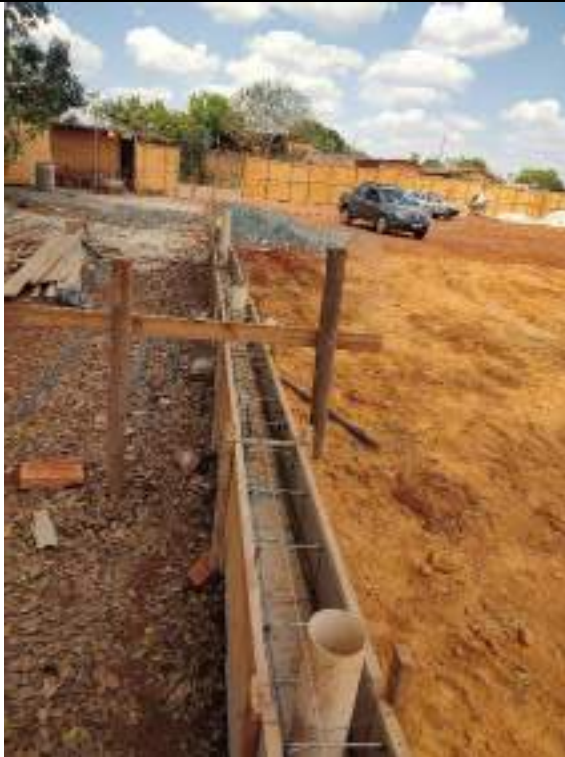
Foto 191 – Forma e concretagem de cintas