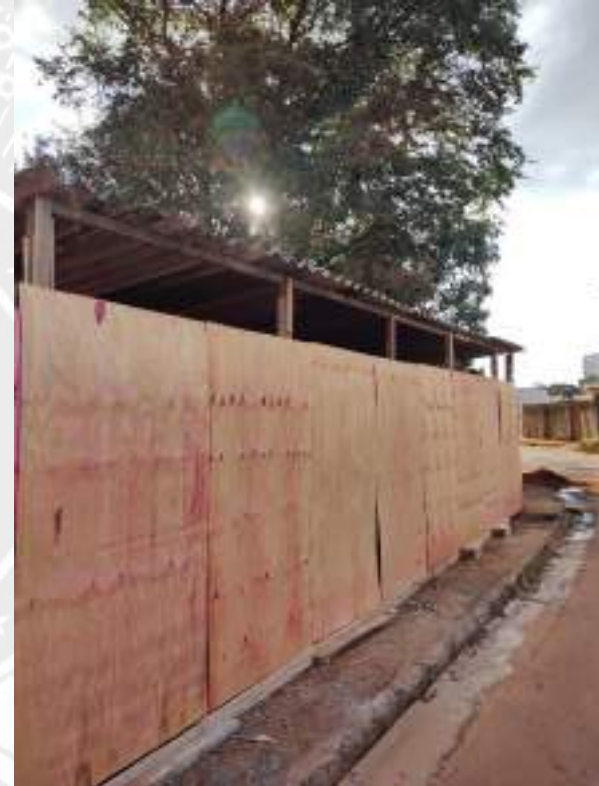
Foto 36 - Execução de telhado do barracão de obra