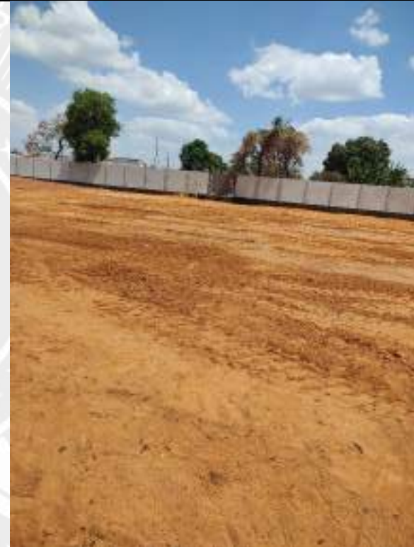
Foto 198 – Acerto e nivelamento de aterro compactado da construção