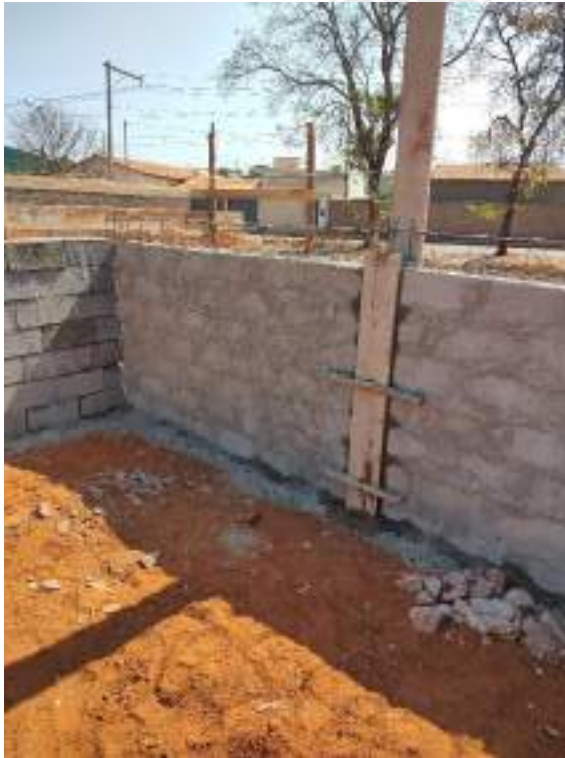
Foto 93 – Execução de muro de arrimo e forma e concretagem de pilares