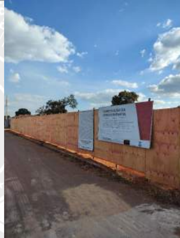
Foto 32 - Placa de obra