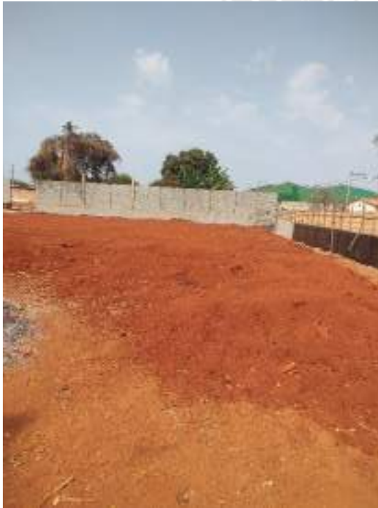
Foto 181 – Aplicação de impermeabilizante em muro de arrimo