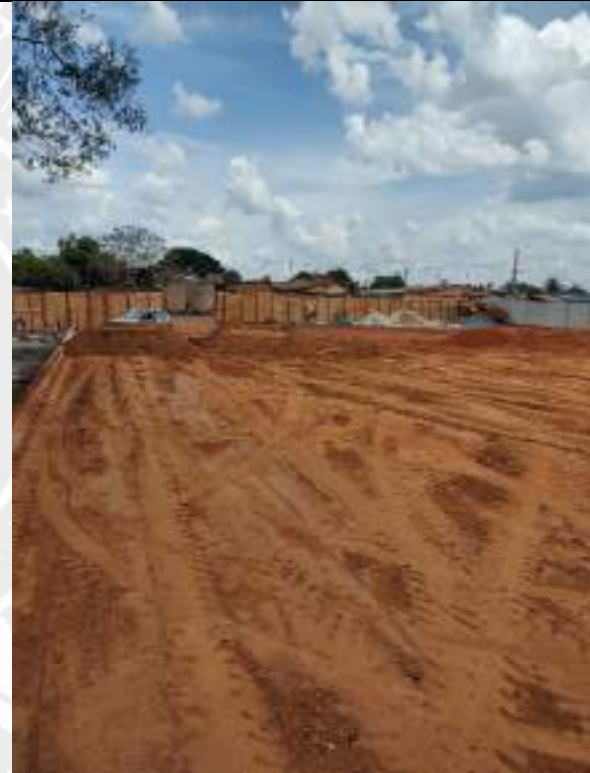
Foto 254 – Execução de aterro compactado