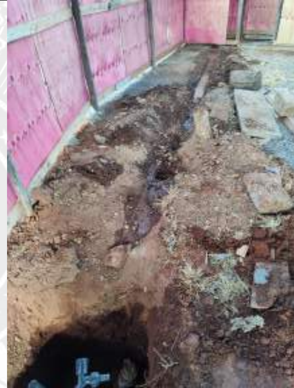
Foto 52 - Execução de rede de esgoto do sanitário do barracão de obra