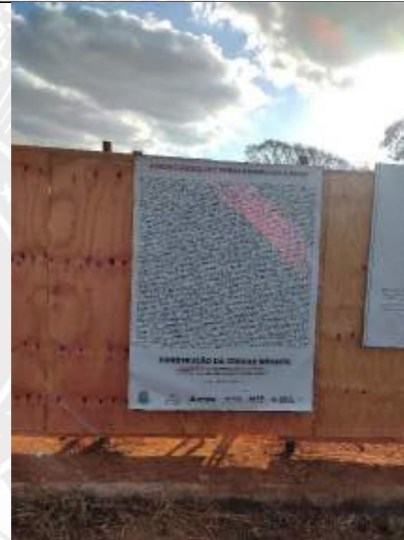
Foto 30 - Placa de obra