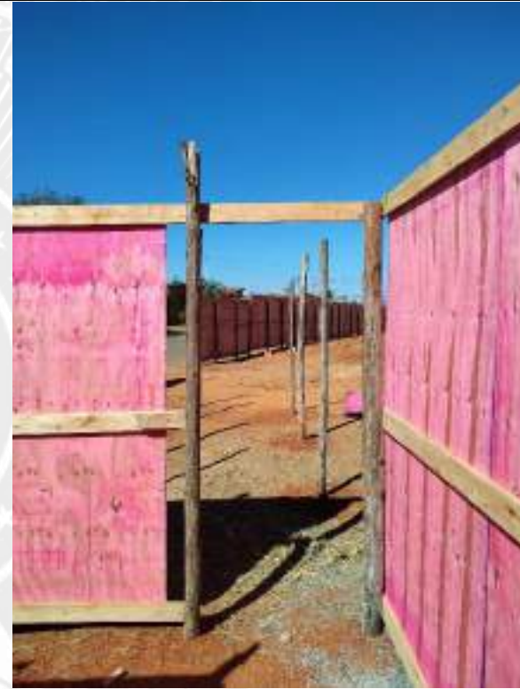
Foto 10 – Execução de barracão de obra com sanitário e depósito