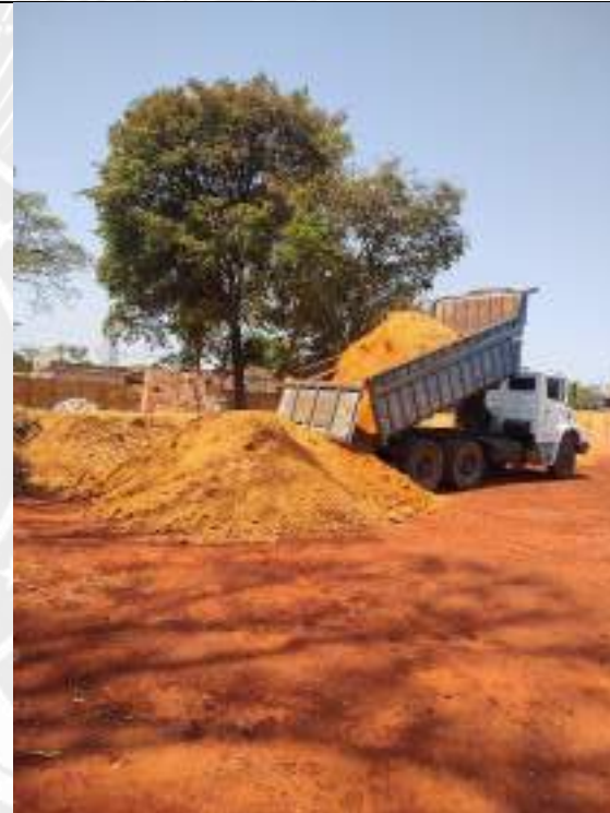
Foto 184 – Execução de aterro compactado da construção