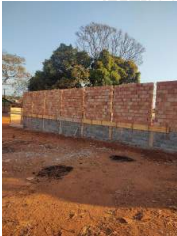
Foto 163 – Execução de muro de divisa