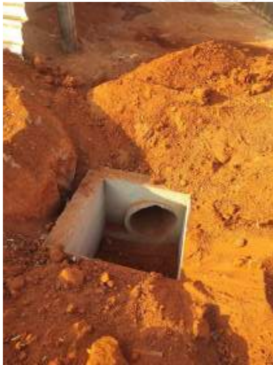
Foto 143 – Execução de caixa de drenagem