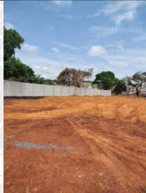
Foto 244 – Execução de aterro compactado