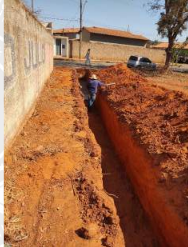
Foto 122 – Acerto de fundo de vala e concretagem de berço