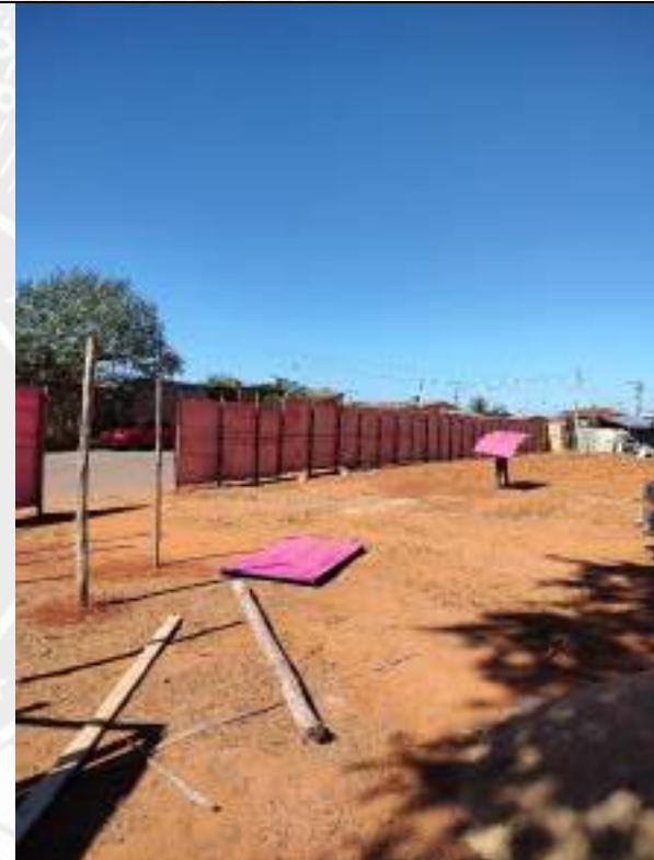
Foto 20 – Execução de tapume para fechamento de obra