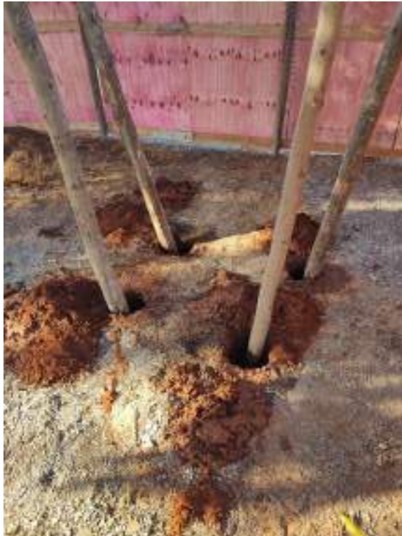
Foto 61 – Execução de suporte para caixa d'água do barracão de obra