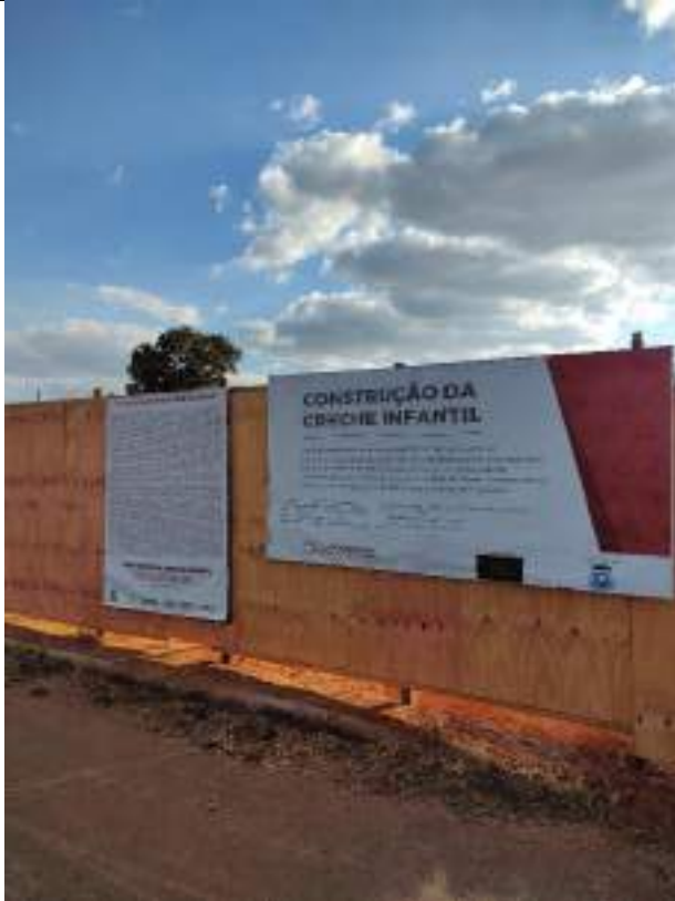
Foto 31 - Placa de obra