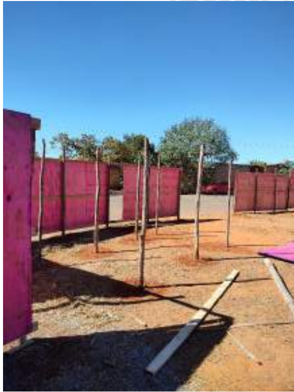
Foto 19 – Execução de barracão de obra