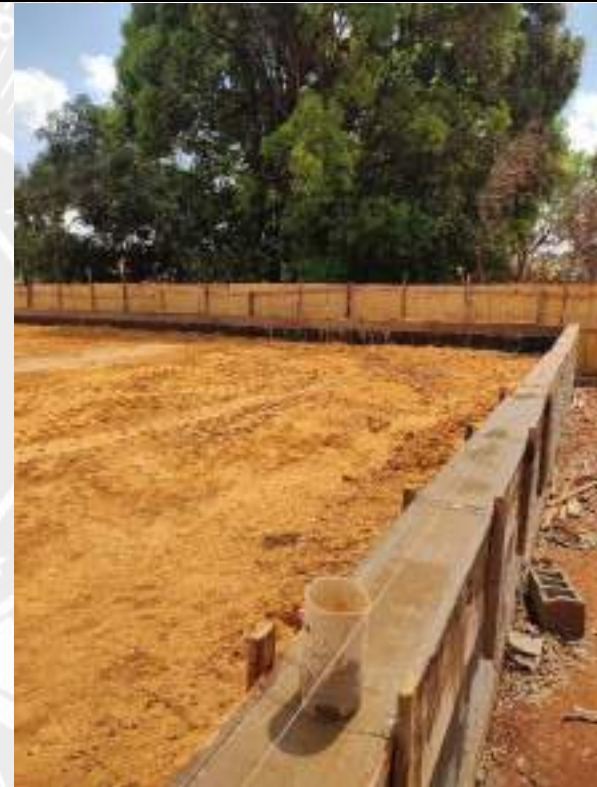
Foto 196 – Forma e concretagem de cintas