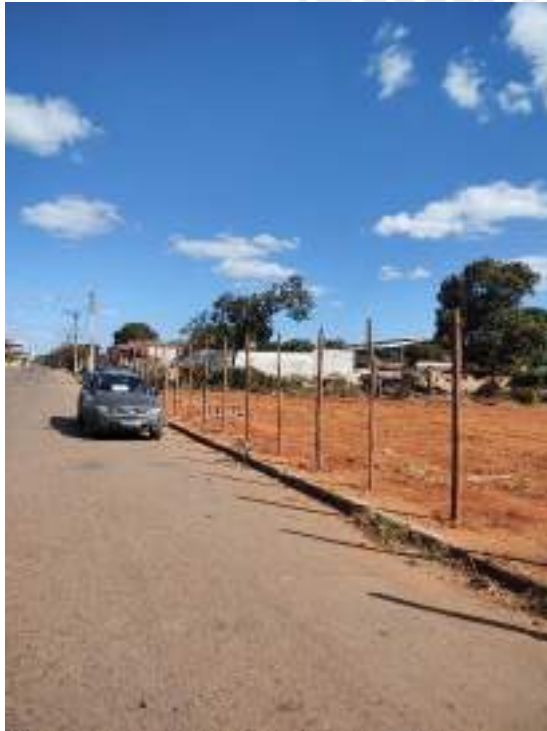
Foto 5 - Execução de tapume para fechamento de obra