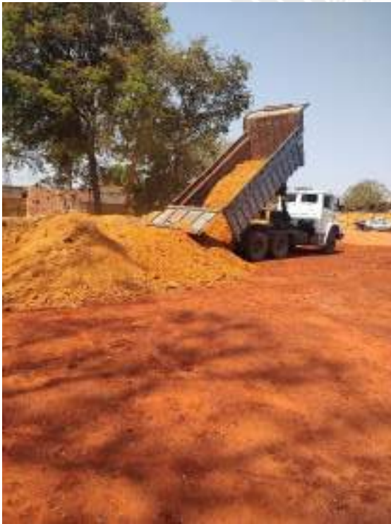
Foto 189 – Execução de aterro compactado da construção