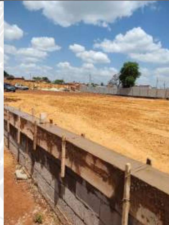
Foto 204 – Forma e concretagem de cintas