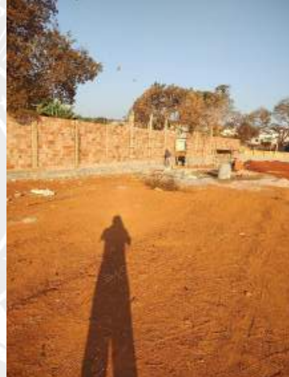
Foto 116 – Execução de muro de divisa