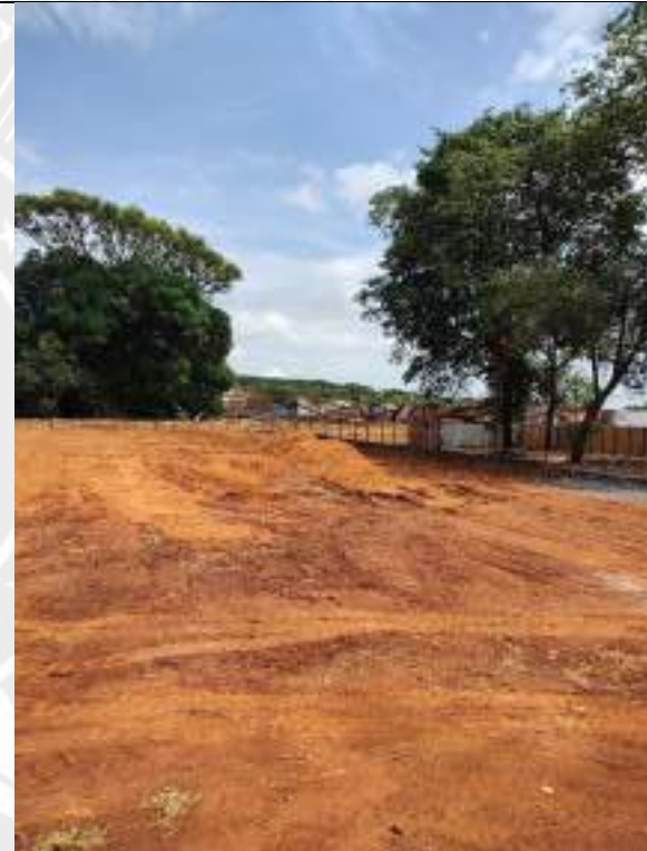
Foto 242 – Execução de aterro compactado