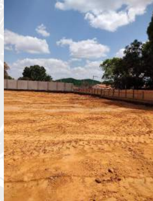
Foto 200 – Acerto e nivelamento de aterro compactado da construção