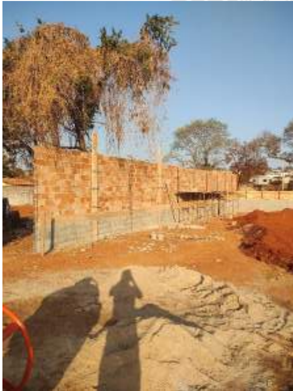
Foto 147 – Execução de muro de divisa