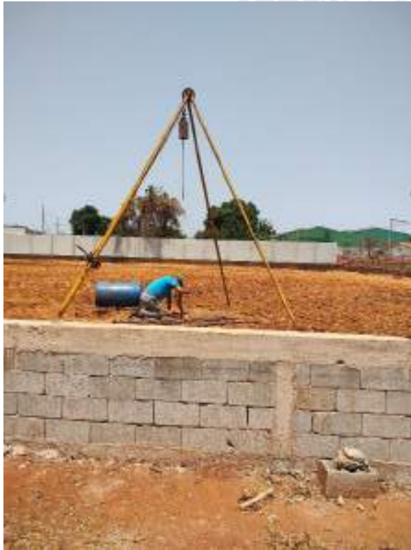
Foto 237 – Execução de furos de sondagem