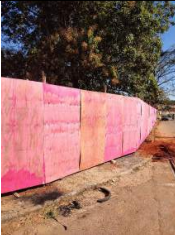
Foto 27 - Execução de tapume para fechamento de obra