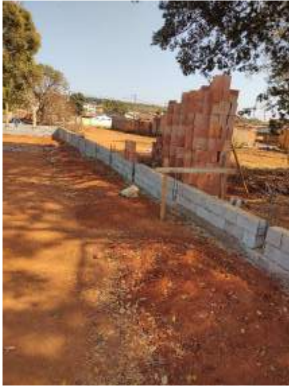
Foto 81 – Execução de muro de arrimo