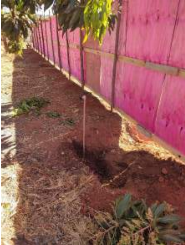
Foto 17 - Execução de ligação provisória de água