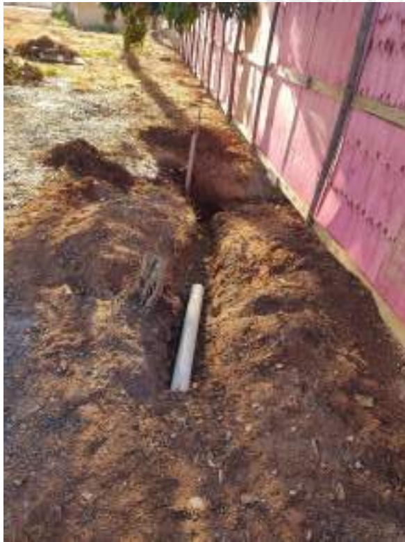
Foto 63 – Execução de ligações hidrossanitárias do banheiro do barracão de obra