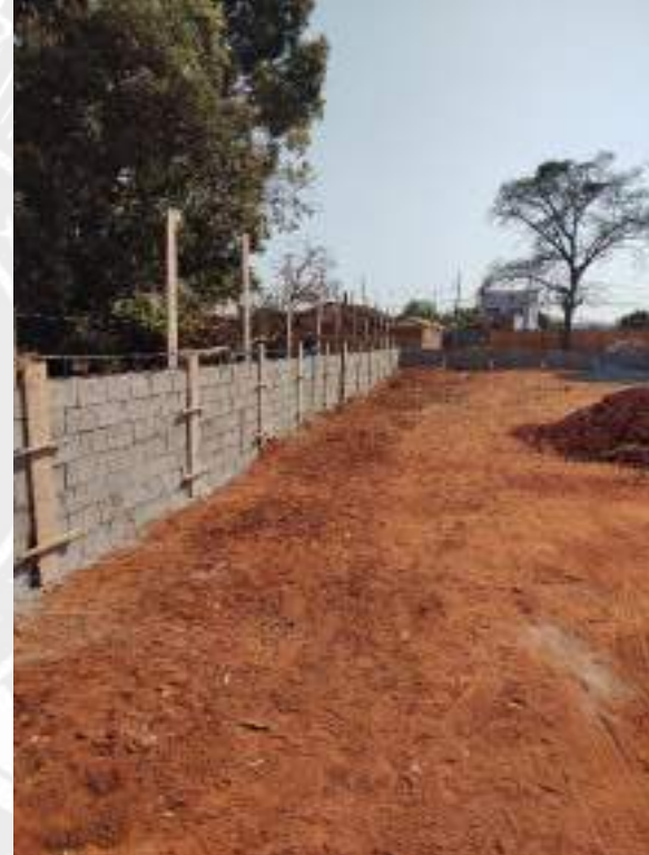
Foto 92 – Execução de muro de arrimo e forma e concretagem de pilares