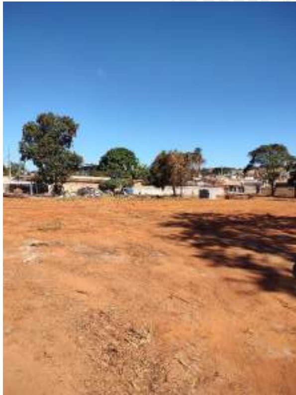
Foto 21 – Limpeza e remoção de cerca de divisa