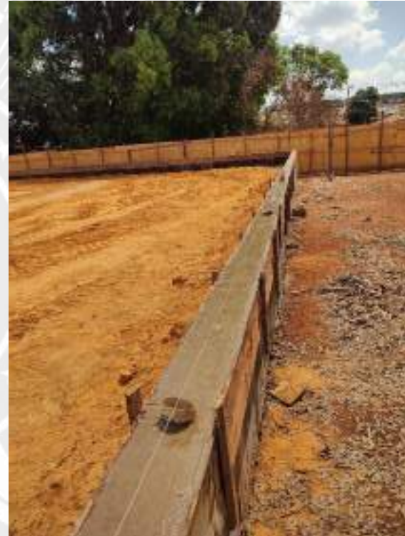
Foto 194 – Forma e concretagem de cintas