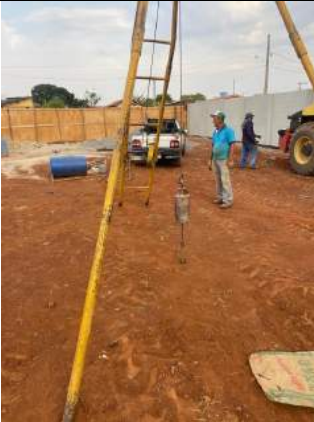
Foto 239 – Execução de furos de sondagem