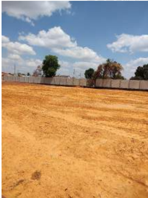
Foto 201 – Acerto e nivelamento de aterro compactado da construção