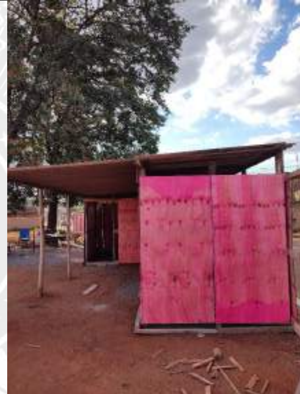
Foto 38 - Execução de telhado do barracão de obra