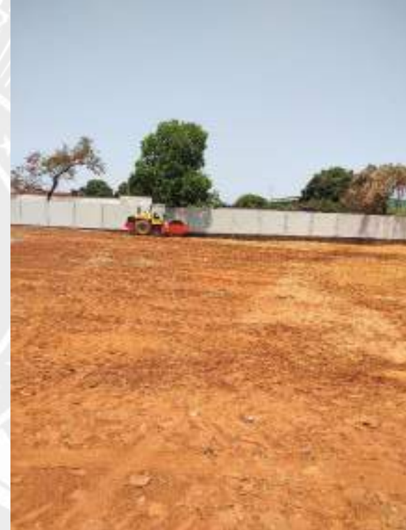
Foto 226 – Execução de compactação mecanizada do aterro da obra