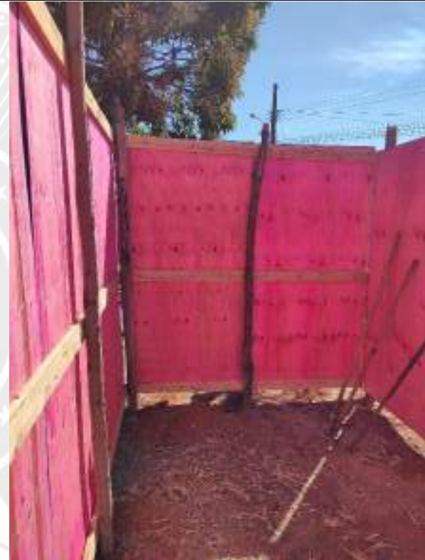
Foto 8 - Execução de barracão de obra com sanitário e depósito