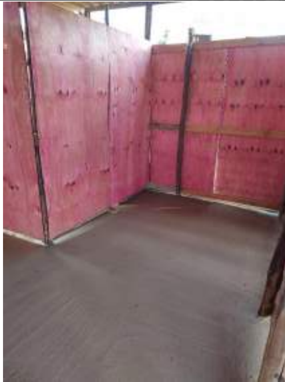
Foto 45 - Acerto e concretagem de piso dos barracões de obra