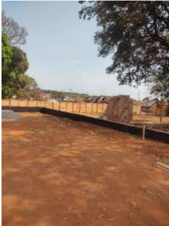
Foto 173 – Aplicação de impermeabilizante em muro de arrimo