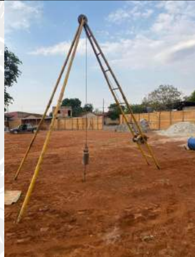
Foto 238 – Execução de furos de sondagem