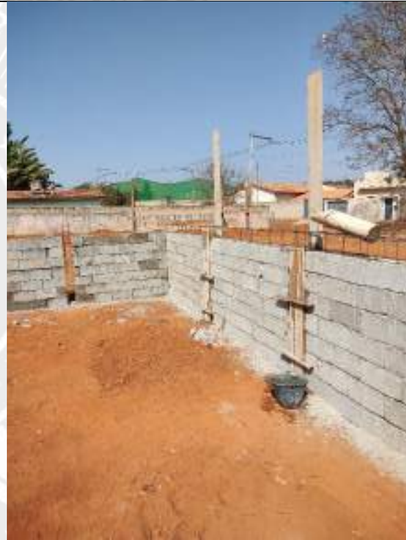
Foto 88 – Execução de muro de arrimo e concretagem de pilares