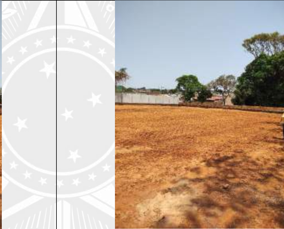
Foto 228 – Execução de compactação mecanizada do aterro da obra