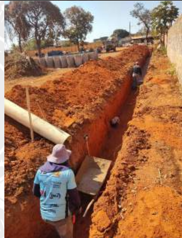
Foto 120 – Execução de rede de drenagem de 600mm