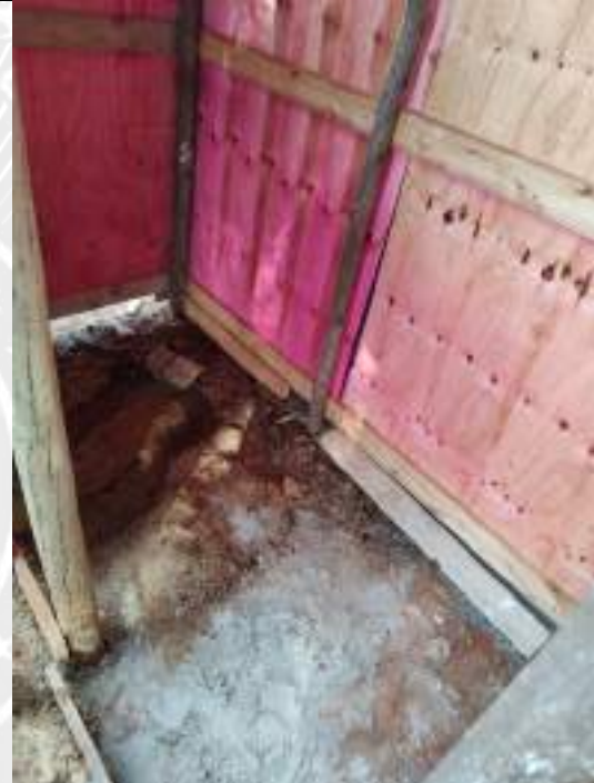
Foto 48 - Execução de redes hidrossanitárias do banheiro do barracão de obra