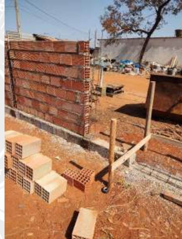
Foto 102 – Execução de muro de divisa