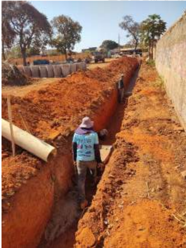
Foto 121 – Execução de rede de drenagem de 600mm