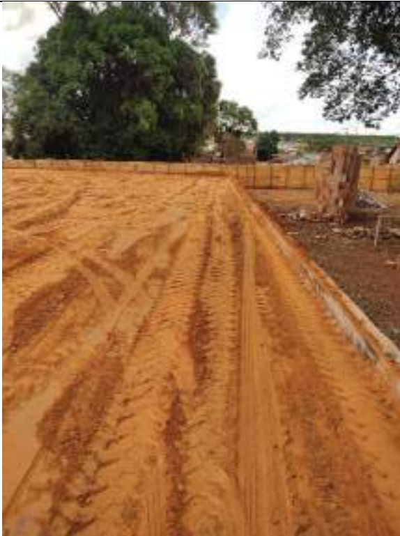
Foto 249 – Execução de aterro compactado