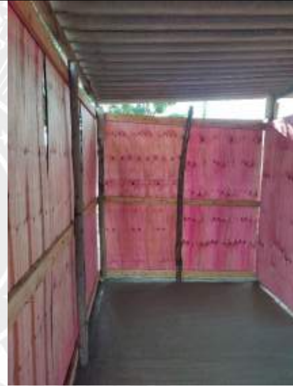
Foto 46 - Acerto e concretagem de piso dos barracões de obra