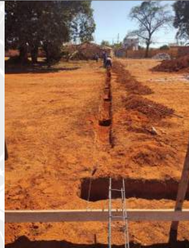
Foto 78 – Execução de gabarito de obra e Execução de fundação do muro de arrimo