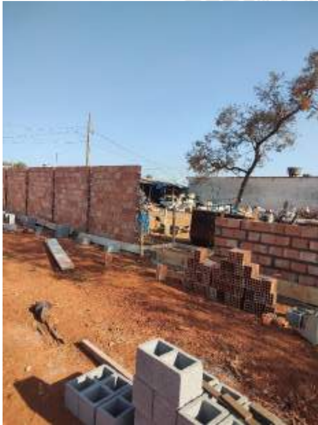
Foto 107 – Execução de muro de divisa