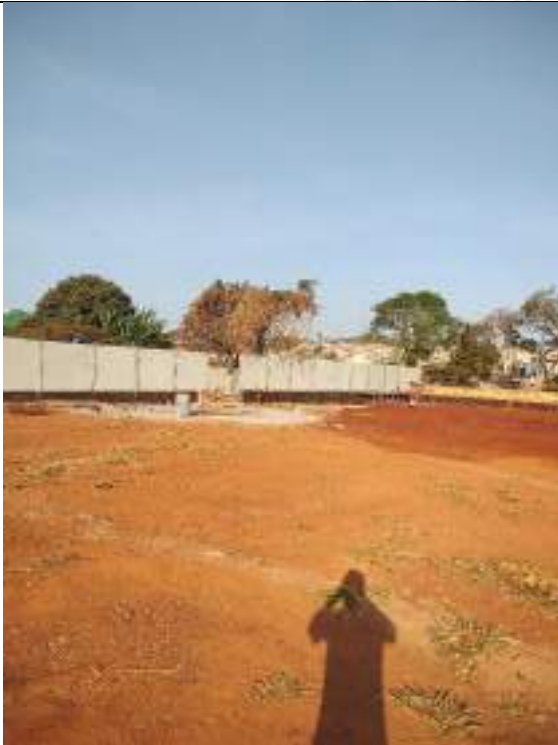
Foto 183 – Execução de chapisco e reboco do muro de divisa