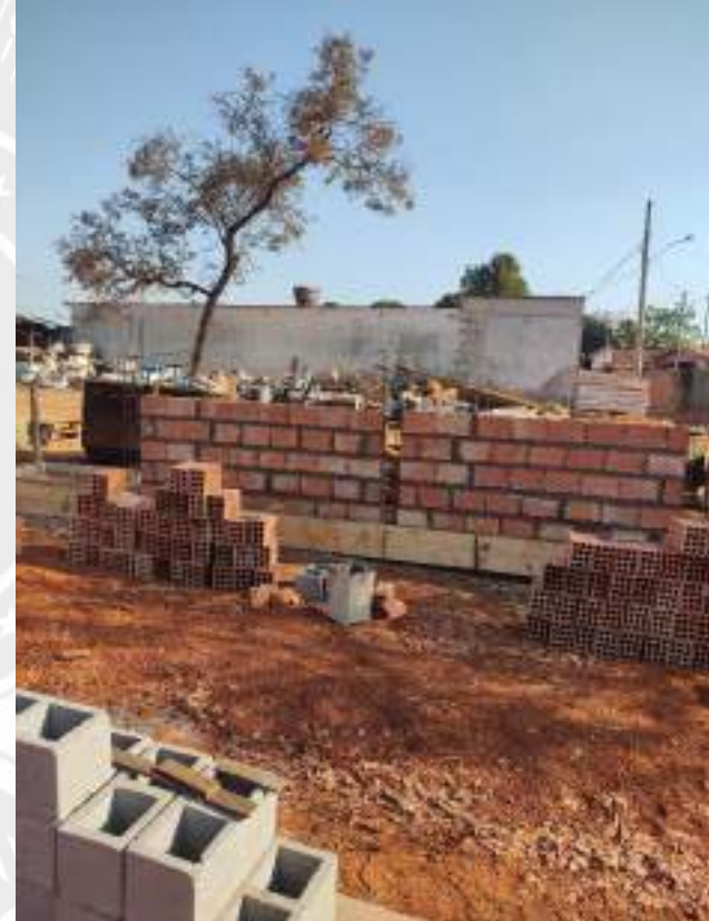
Foto 108 – Execução de muro de divisa