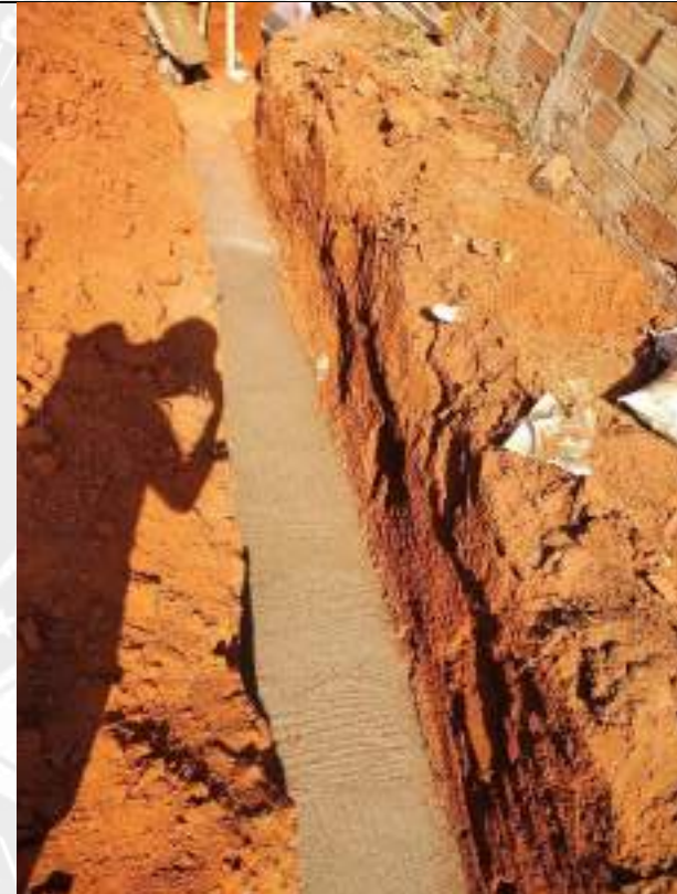
Foto 126 – Acerto de fundo de vala e concretagem de berço