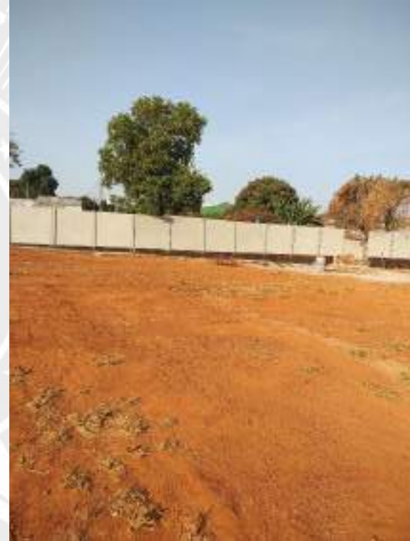
Foto 182 – Aplicação de impermeabilizante em muro de arrimo