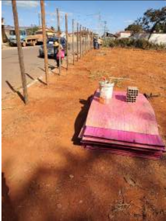
Foto 1 – Execução de tapume para fechamento de obra