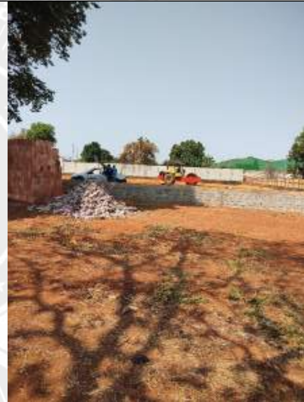
Foto 224 – Execução de compactação mecanizada do aterro da obra