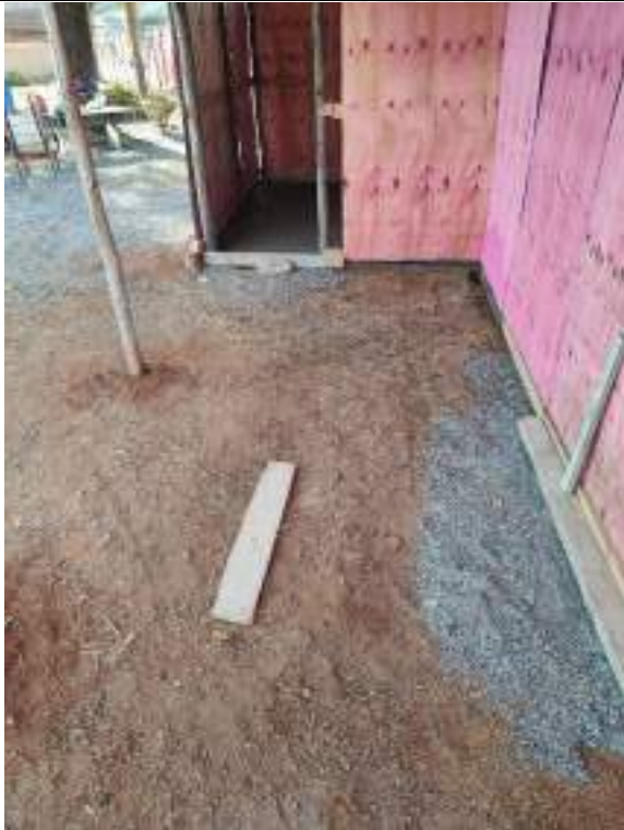
Foto 43 - Acerto e concretagem de piso dos barracões de obra