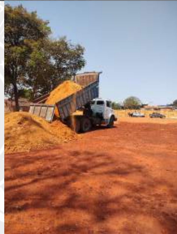
Foto 186 – Execução de aterro compactado da construção