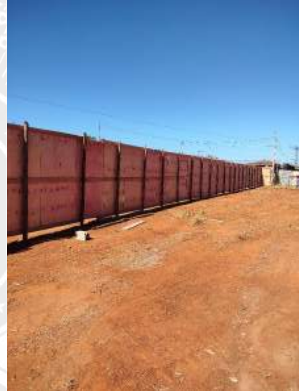
Foto 22 – Execução de tapume para fechamento de obra