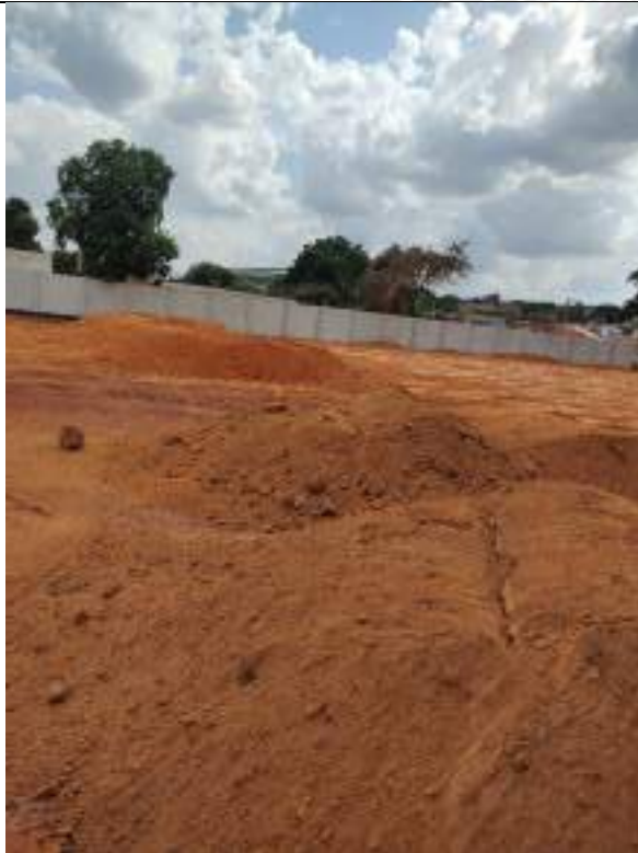
Foto 245 – Execução de aterro compactado