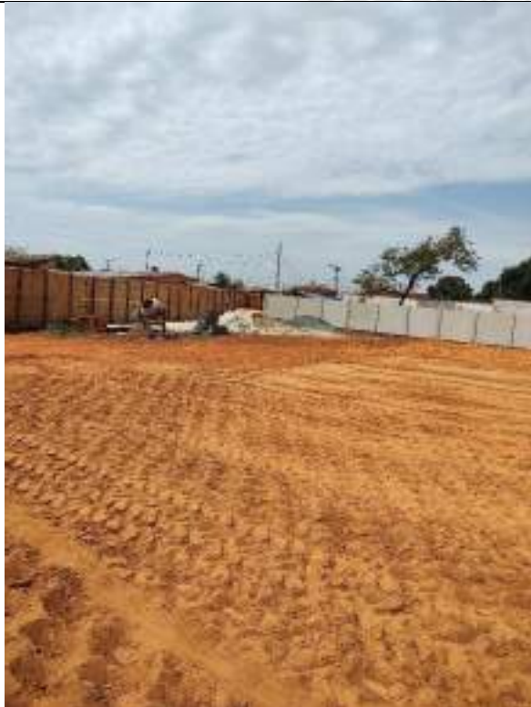
Foto 259 – Execução de aterro compactado