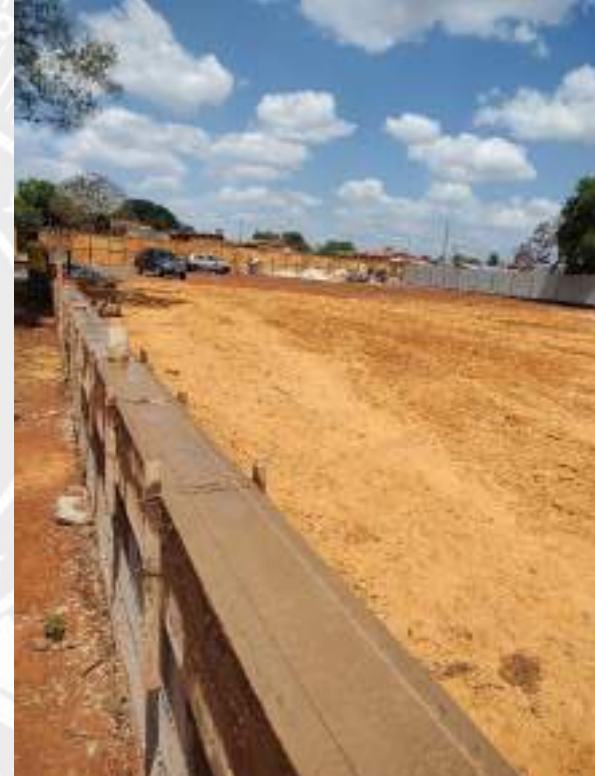
Foto 202 – Acerto e nivelamento de aterro compactado da construção