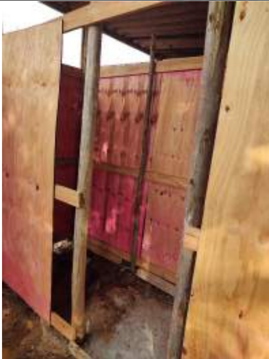
Foto 47 - Execução de redes hidrossanitárias do banheiro do barracão de obra