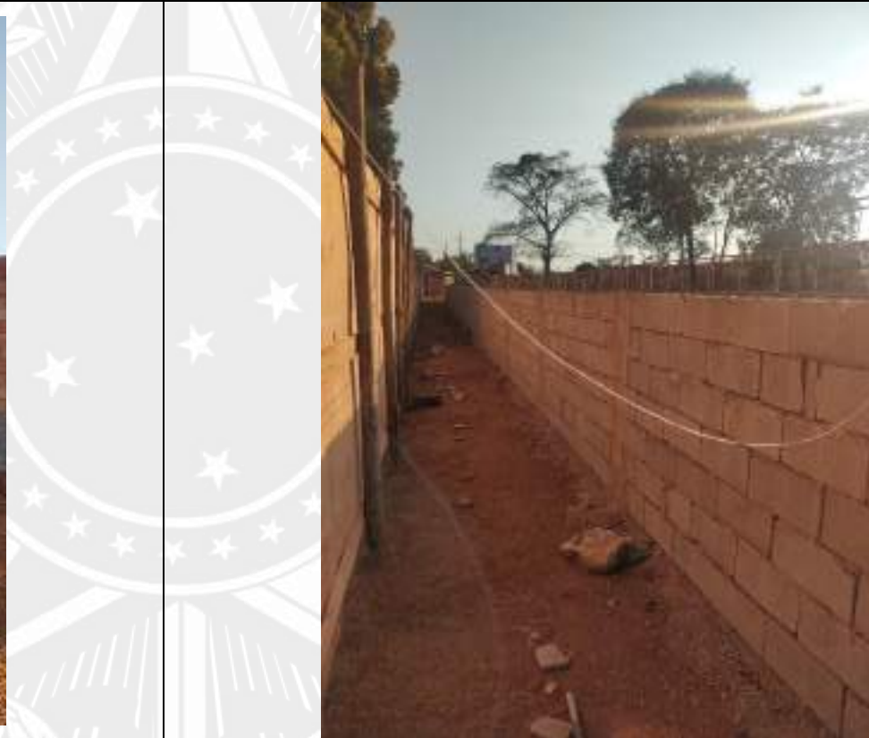
Foto 164 – Execução de muro de arrimo e tapume de fechamento de obra